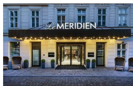
ル メリディアン ウィーン