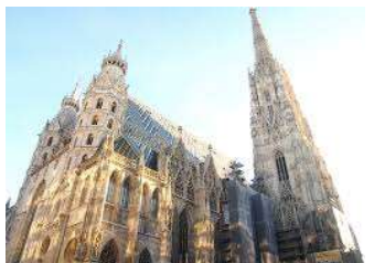
シュテファン寺院