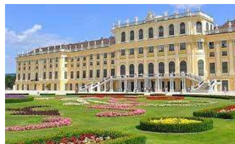
シェーンブルン宮殿