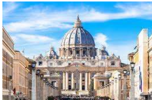
バチカン（サンピエトロ大聖堂）