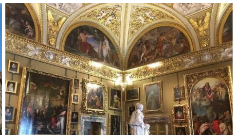
パラディーナ絵画館