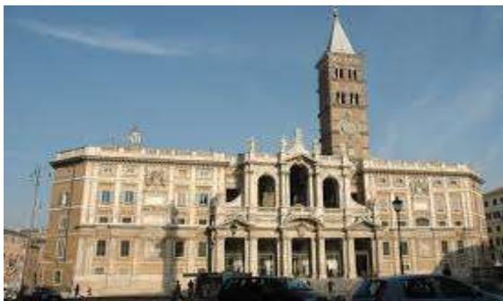
サンタマリアマッジョーレ大聖堂