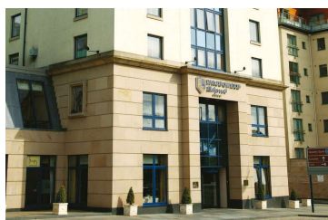
マクドナルド ホリールード・ホテル