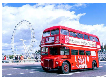
ロンドン (マイバス)