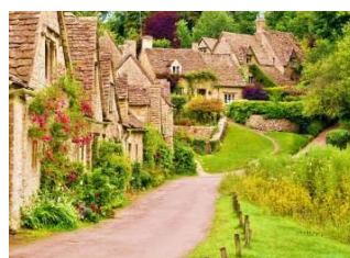
コッツウォルズ (バイブリー)