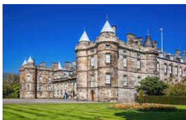
ホリールード宮殿