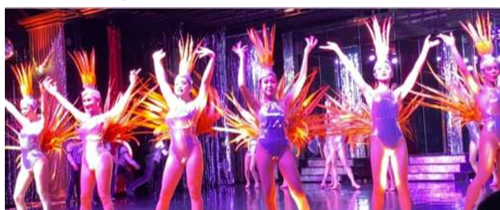
カリプソンキャバレー・ニューハーフショー